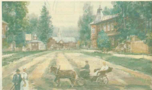
Лосинка. 1912 г. Дорога к вокзалу

ма со Львом Толстым, и распросить ее, каков был гений в жизни. В булочную на Рудневой частенько заглядывал известный коллекционер живописи Вишне-ский, брат знаменитого медика (помните — мазь Вишне-вского)?