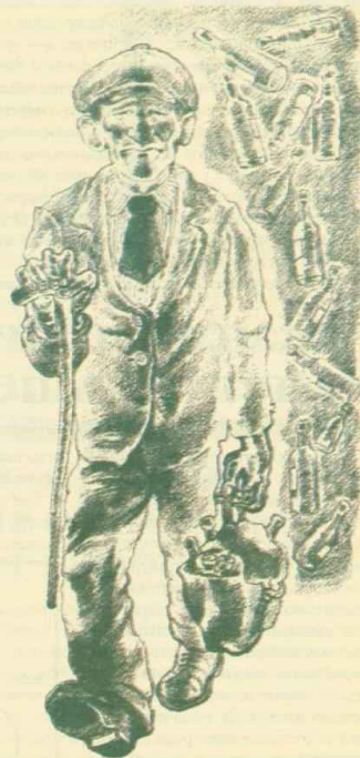
Собирателъ бутылок. 1965 г.