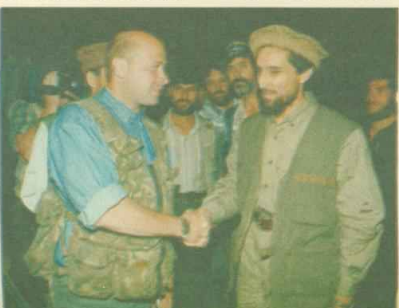
Афганистан. С.Ахмад Шах Масудом.

ный. Видимо, ни раз ему приходилось пробывать в эфир ваши колочные передачи?